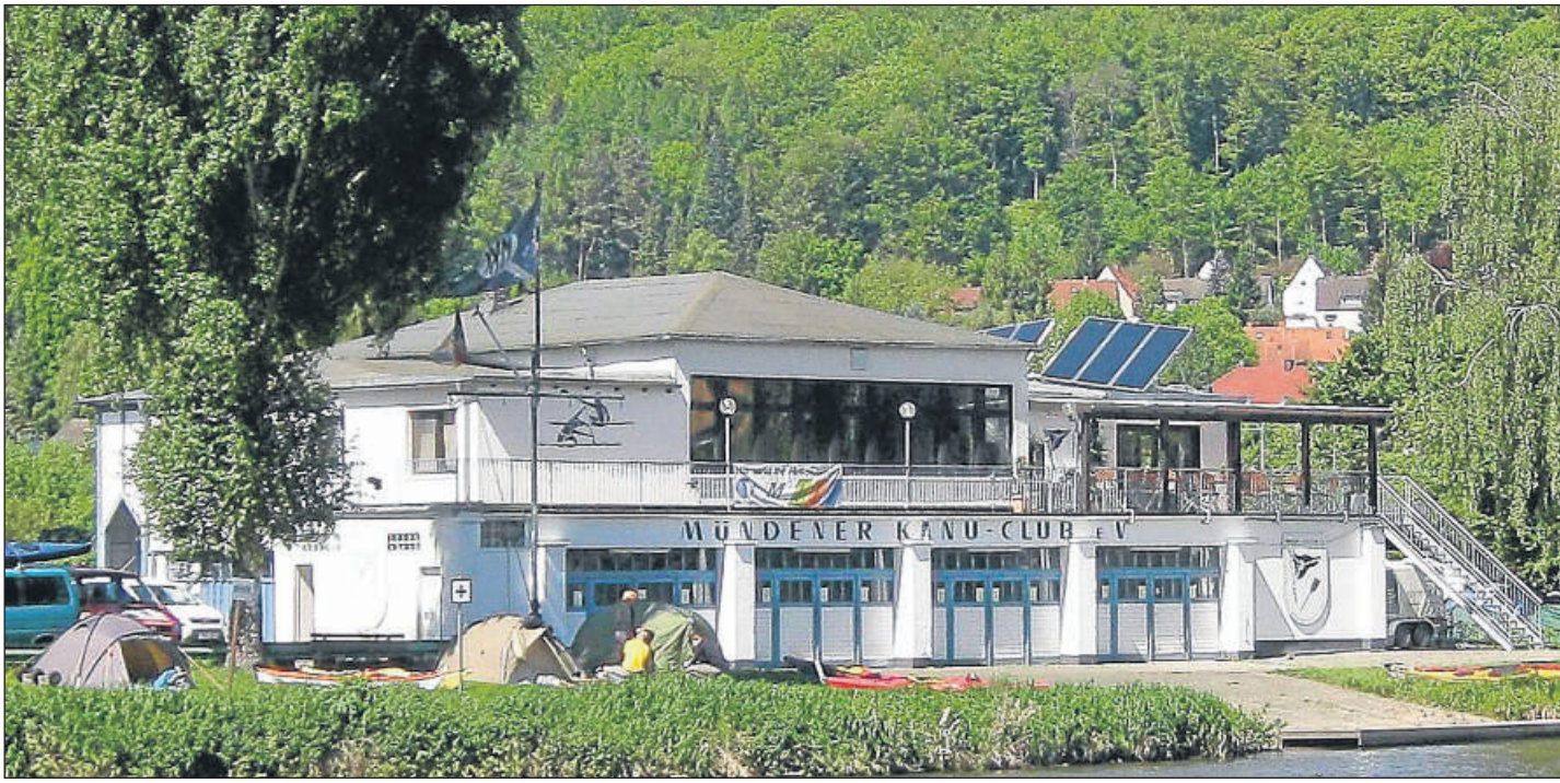
Das Bootshaus heute: Der Mündener Kanu-Club besteht seit 65 Jahren. Das Bootshaus wurde in den Jahren 1952 bis 1955 in Eigenleistung errichtet und danach immer weiter ausgebaut.